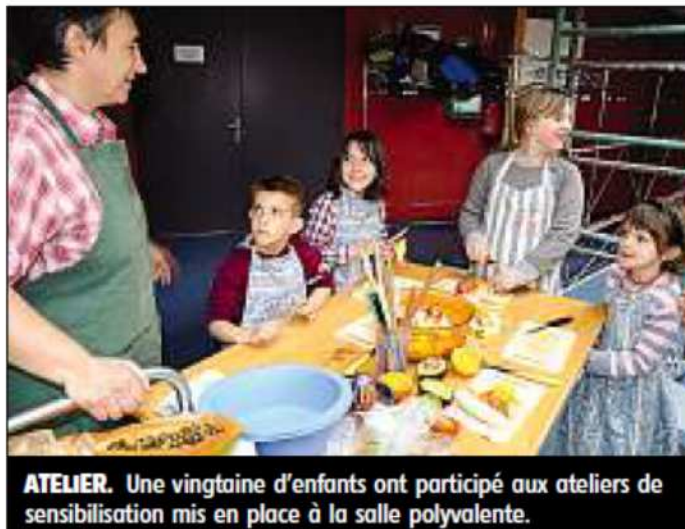
ATELIER. Une vingtaine d'enfants ont participé aux ateliers de sensibilisation mis en place à la salle polyvalente.

Une sensibilisation et une réflexion en profondeur qui viennent d'aboutir à la labellisation Agenda 21 de Ménétrol. « Nous